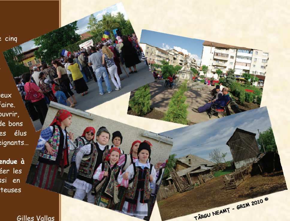
TÂRGU NEAMȚ - GRIM 2010 ©