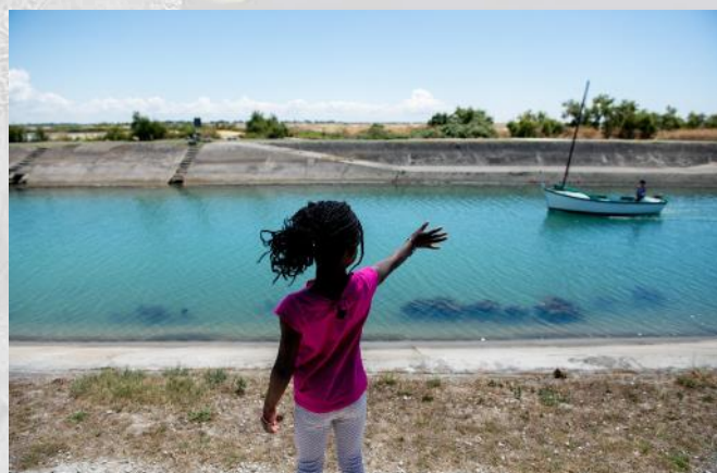
Morgane, 6 ans, découvre La Rochelle.

https://www.facebook.com/profile.php?id=100081307821859